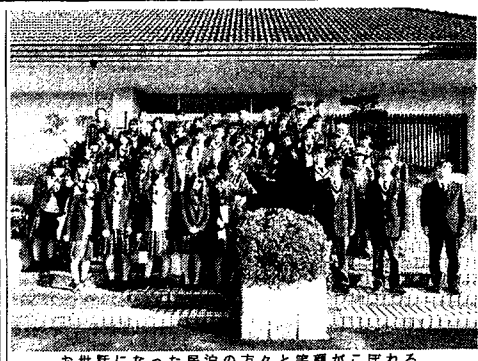
お世話になった民泊の方々とお別れがこぼれる

十月十八日(火)から十九日(水)まで、二年生は南薩地方へ修学旅行に出かけた。冬もあたたかい南薩地方で、生徒は自然の美しさや歴史・文化、そして人情の温かさに素直らしい思い出をお土産に帰ってきた。